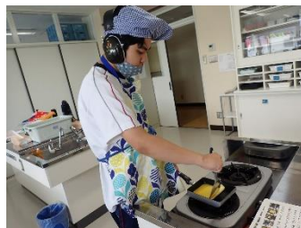
中3・弁当のおかずづくり