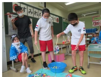
小・すみれのおまつり