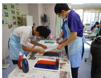
高・カレンダーづくり