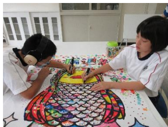
中1・アマビエづくり