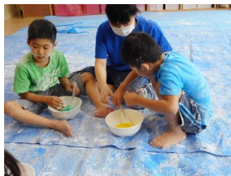
小・たんぼぼ 粉遊び